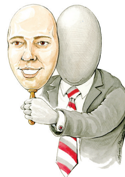
ΑΝΔΡΟΣ (ΓΑΥΡΙΟ) 10-17 ΙΟΥΛΙΟΥ 2016

Το πρόγραμμα είναι συνέχεια της περυσινής ακαδημαϊκής δράσης που πραγματοποιήθηκε με μεγάλη ομολογουμένως επιτυχία στην Άνδρο. Φέτος διευρύνεται με δύο κύκλους και υποστηρίζεται από το Κέντρο Ελληνικών Σπουδών (Ελλάδος) του Πανεπιστημίου Harvard και το Γραφείο Ελλάδος του Ευρωπαϊκού Κοινοβουλίου. Προσφέρεται σε προπτυχιακούς και μεταπτυχιακούς φοιτητές, απόφοιτους, υποψήφιους διδάκτορες, ερευνητές, εκπαιδευτικούς και δημοσιογράφους. Οι συμμετέχοντες θα επιλεγούν κατόπιν αξιολόγησης. Το 2ο Θερινό Πανεπιστήμιο περιλαμβάνει καθημερινές τετράωρες διαλέξεις, εργαστήρια, συναντήσεις ανταλλαγής ιδεών στο τέλος κάθε εργαστηρίου/διάλεξης, καθώς και πολιτιστικές δραστηριότητες και εκπαιδευτικές εκδρομές. Στο πρόγραμμα θα διδάξουν κορυφαίοι ακαδημαϊκοί καθηγητές από ελληνικά και ξένα πανεπιστήμια. Στη Διεθνή Τιμητική Επιτροπή συμμετέχουν εξέχουσες προσωπικότητες από την Ελλάδα και το εξωτερικό. Τις εικόνες των αφισών φιλοτέχνησαν ο σκιτσογράφος κ. Ηλίας Μακρής και ο εικαστικός κ. Ηλίας Δελλόγλου, ενώ το έντυπο υλικό επιμελήθηκε ο κ. Γιάννης Μαμάνης από τις εκδόσεις Gutenberg.