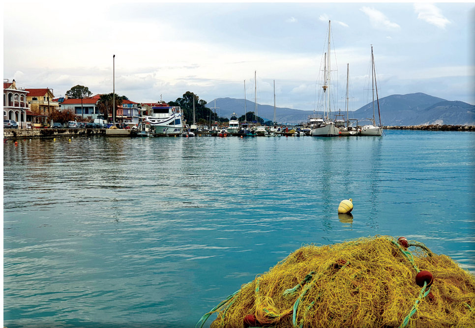
Άποψη του Ληξουρίου / View of Lixouri